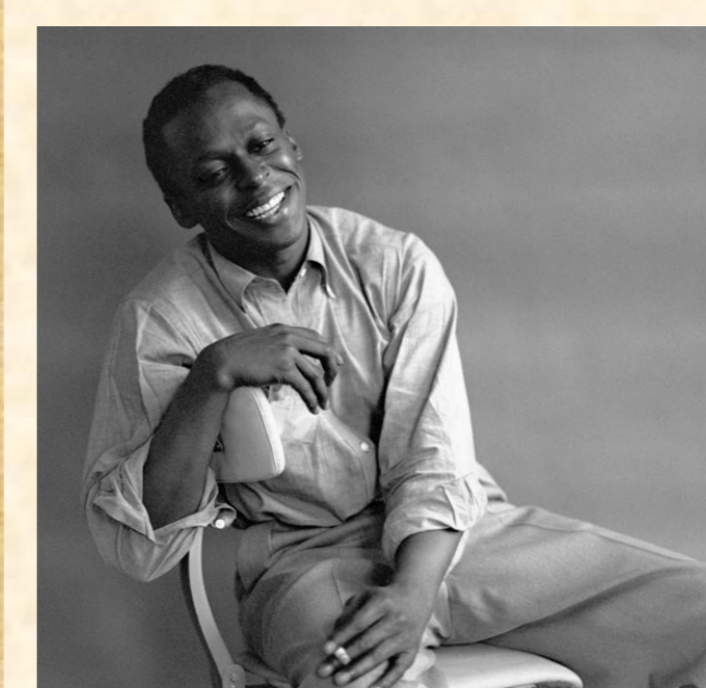
Miles Davis , figure centrale du jazz et de la musique (1926 - 1991) est un compositeur et trompettiste de jazz américain.

Encore appelé jazz-rock, il apparaît à la fin des années 1960 comme un croisement entre l'énergie du rock, le climat du funk et l'approche harmonique du jazz. Miles Davis en est le précurseur. Le jazz-rock accorde une importance grandissante à la rythmique binaire au détriment du swing. Cette période a laissé des traces durables dans la mosaïque postmoderne du jazz.