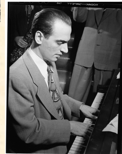
Lennie Tristano (1919—1978) est un pianiste et compositeur de jazz américain.

À la fin des années 1940, un nouveau courant s'affirme autour de Lennie Tristano ou de Miles Davis : le cool. Il va à l'encontre des tempos ultrarapides du BEBOP et renoue avec la fluidité et l'héritage de Lester Young, la cohésion des timbres et le beau son.