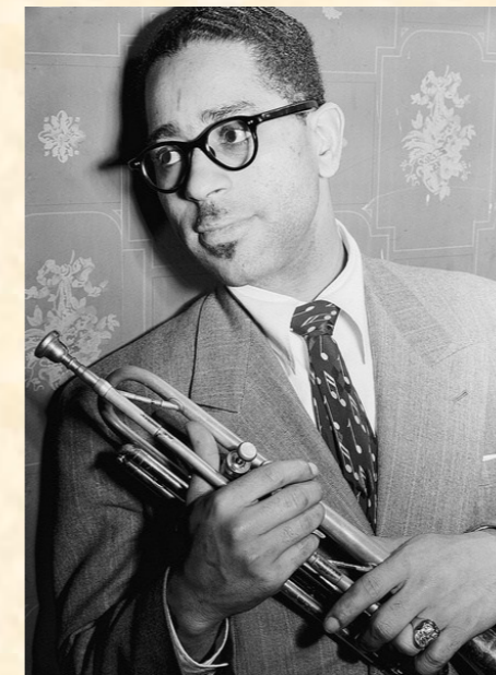
Dizzy Gillespie (1917—1993), l'un des trois plus importants trompettistes de l'histoire du jazz, auteur-compositeur-interprète et chef d'orchestre de jazz américain.

Au début des années 1940, quelques jazzmen, parmi lesquels Charlie Parker, Dizzy Gillespie et Thelonious Monk, Kenny Clarke se retrouvent lors de jam-sessions à New York. Ils y expérimentent une nouvelle forme de musique improvisée qui modifie profondément la couleur sonore du jazz : le BEBOP.