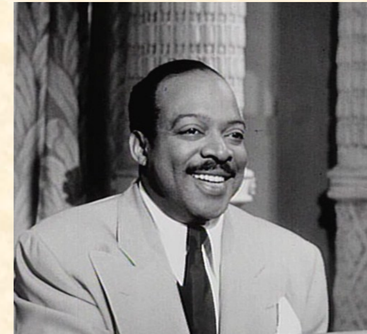
Count Basie (1904—1984), la machine à swing. Pianiste, organiste et chef d'orchestre de jazz.

Le mainstream désigne le jazz classique, celui des années 1930 et 1940. Il ne désigne pas seulement une époque, mais aussi un style d'écriture : le swing. C'est l'âge d'or du jazz, la phase historique la plus féconde et la plus équilibrée de toute l'histoire du jazz. Il recouvre des musiques aussi diverses que celles de Duke Ellington, Count Basie, Benny Goodman, Fats Waller, Erroll Garner, Tommy Dorsey, etc.