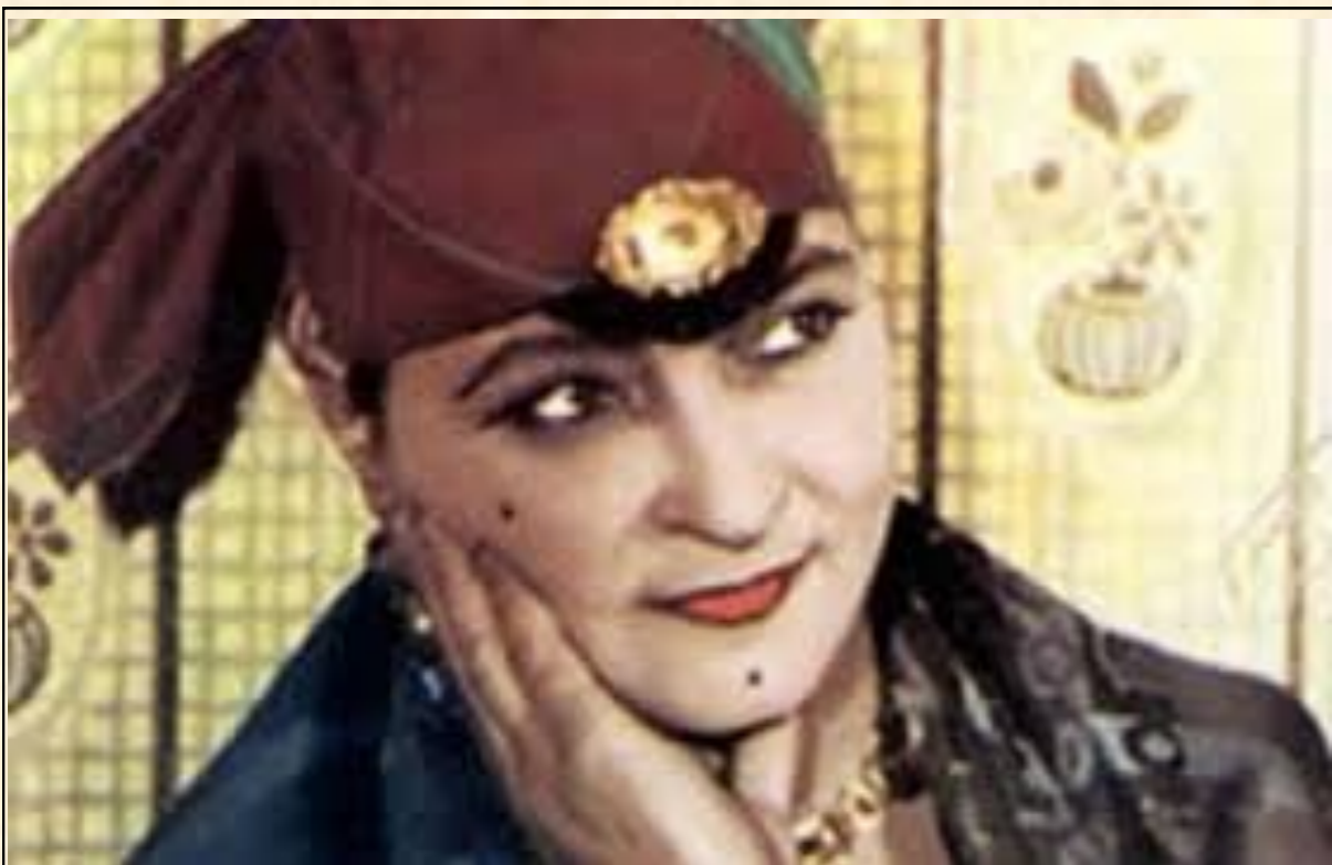
Léona GABRIEL (1885—939)

L'instrument par excellence est sans conteste la clarinette, dont les grands interprètes ont toujours su exploiter l'expressivité, la richesse des nuances et des variations. Les premiers orchestres comprennent aussi le trombone. Mais les instruments à cordes : guitare, violon, violoncelle, tiennent aussi une place de choix. Enfin, n'oublions pas l'incontournable "chacha", cylindre de fer blanc rempli de grenaille, dont des mains virtuoses savent extraire un rythme puissant, envoûtant, tour à tour exalté ou lancinant, propre à enflammer les pieds des danseurs.